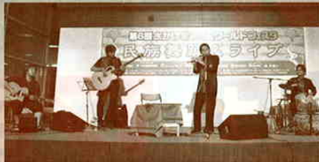
チョウタリバンド(ネパール音楽)

ステージでは世界各国の舞踊やライブが楽しめます。そこは、まさしくエキゾチックな世界。民族衣装をまとった独特の雰囲気に引き込まれます。迫力満点のムエタイデモンストレーションもあり、必見です。