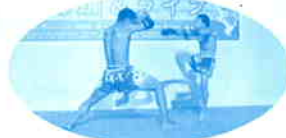
▲迫力あるムエタイショー