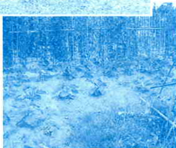
▲敷地内にある農園

アジアホープ孤児院は、二年前に五つの少数民族の子供達のために開かれた孤児院で、現在、七三名が暮らしています。現在新規に百十名の収容希望申請が出ており、当友好協会が託児施設を建設することで、〇歳〜三歳の子供達の新規収容が可能になります。 施設の面積は約五十坪、費用は日本円で約二五〇万円、建設は十月半ばから開始し、来年一月には完成する予定です。また完成に合わせて、親善訪問を実施する予定です。 なお、本事業については、(財)埼玉県国際交流協会へ、助成金の支給申請を行います。