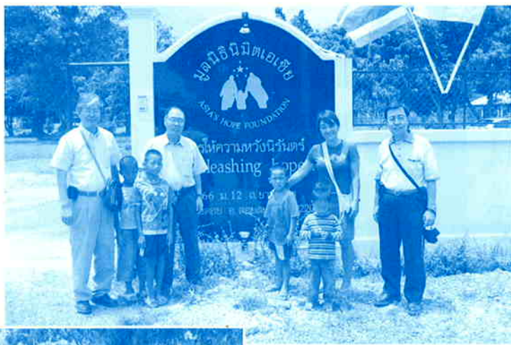
▶アジアホープ孤児院入り口で、小学生の孤児たちと

・この孤児院に〇歳〜三歳児の新規収容のための託児施設を建設するとの結論を得て帰国しました。これを受けて九月四日、さいたま市のパレスホテル大宮にて役員会が開かれ、細部にわたり検討し、正式に決定いたしました。