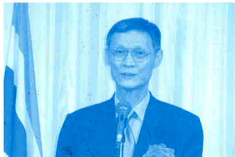
▲当協会への期待と感謝を述べるスウィット・シマサクン駐日タイ王国大使