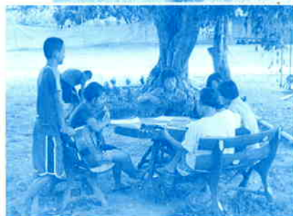
▲木陰でくつろぐ中学生の孤児達