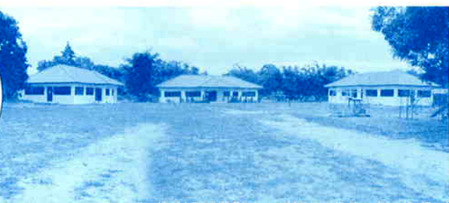
▲既存の寄宿舎は、今年竹構造からコンクリート造りへと改築された。向かって左から男子寄宿舎、共同スペース施設、女子寄宿舎。0〜3歳児託児施設は、右側後方に建設される予定。