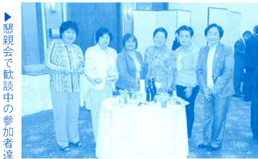
▶懇親会で歓談中の参加者達