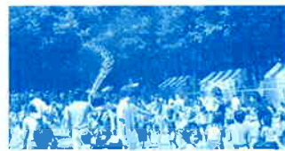
▲元気な子供達で埋まった水かけ会場

世界の味が楽しめる屋台も人気で、中には行列の出来る店も。埼玉にいて世界に触れる、来場者は、そんな一日を楽しんでいるようにみえました。