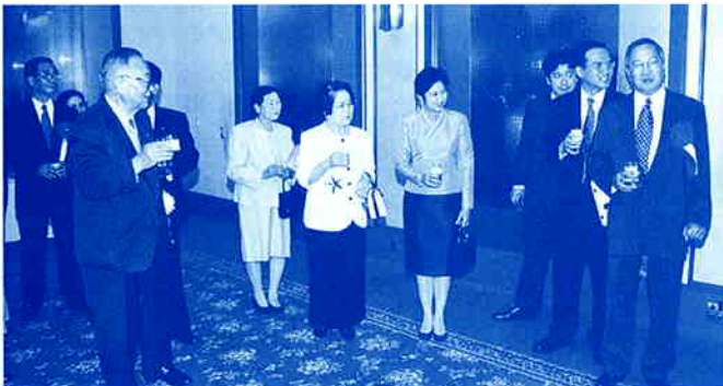
中央右よりグライラーク タイ大使夫人、土屋県知事夫人、原会長夫人