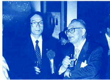
個人会員でもある町田狭山市長と原会長