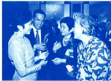
通訳を介し大使夫人と話す会員