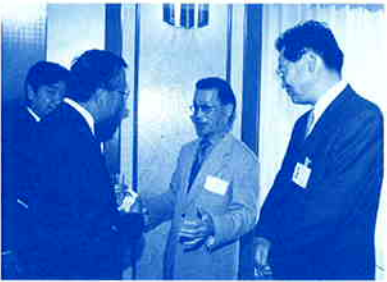
手振り(?)で名刺交換する会員