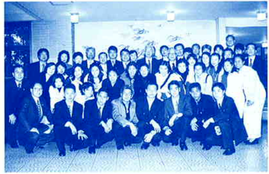
歓迎パーティーに参加の皆さん