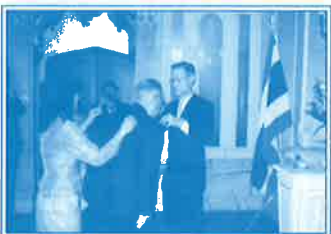
▲平成18年12月 タイ王国大使より、プミポン国王からの勳章を授与される