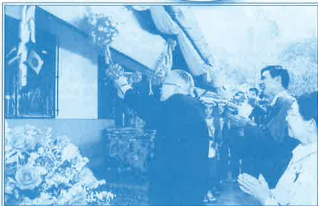
▲平成17年2月 バン・クッド・サムシブ校に寄宿舎を寄贈。竣工式でテープカット