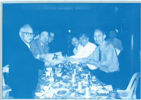
▲平成12年2月 第1回親善訪問で狭山茶の種子をロイヤルプロジェクトに贈呈