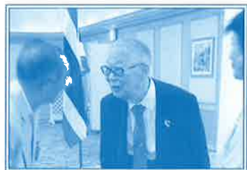
▲平成25年7月 総会後の懇親会で