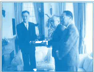
▲平成17年3月 スマトラ沖地震の際、会員より集まった義捐金をタイ王国大使に渡す