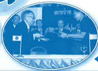
◀平成16年7月 第1回教育施設寄贈の調印式で