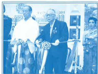
▲平成23年10月タイフェスティバルでテープカット