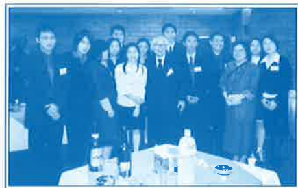
▲平成15年3月 チュラロンコーン大学学生の歓迎会で