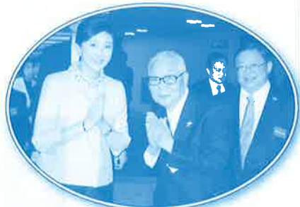
▲平成24年3月 訪日中のインラックタイ首相と面会