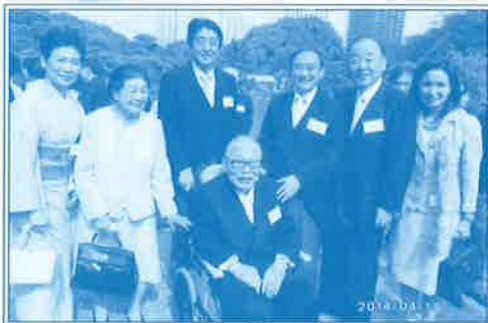
▲平成26年4月 春の園遊会に招かれる