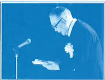
▲平成21年2月 土屋前知事を偲ぶ会で追悼の辞を述べる