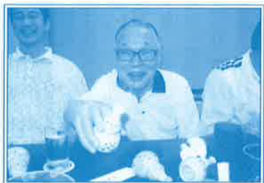
▲日本酒を愛し、すすめ上手でした