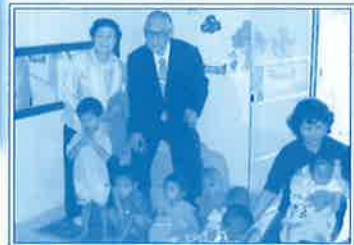
▲平成20年2月 アジアホープ孤児院にて乳幼児とともに