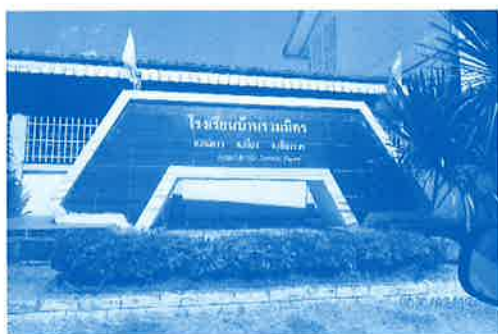
▲候補の1つである幼小中校