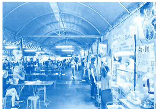
▲タイの屋台市場の様子

買い物や食事を実店舗で楽しむということに加えて、キャッシュレス化、ECサイトの登場により「便利に気軽に素早く」という選択肢も増えたように思います。それぞれをバランス良く使い分けていければと思います。