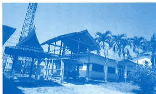
▲候補となっている学校の校舎の一部

今後現地の教育機関担当者との協議し、メーヤオ地区にある9カ所の学校から1校に教育関連施設建設の提案を実施していくことを計画しています。施設内容としては、SDGsの観点から保健室や教室、IT教育室等を考えております。