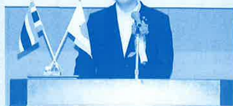
▲当協会の総会で挨拶される前大使閣下